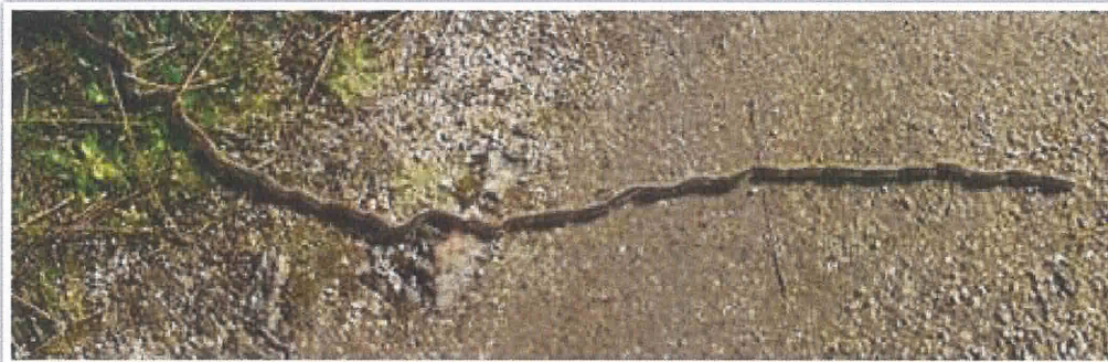
Procession bien visible sur un chemin – Finistère sud, février 2018