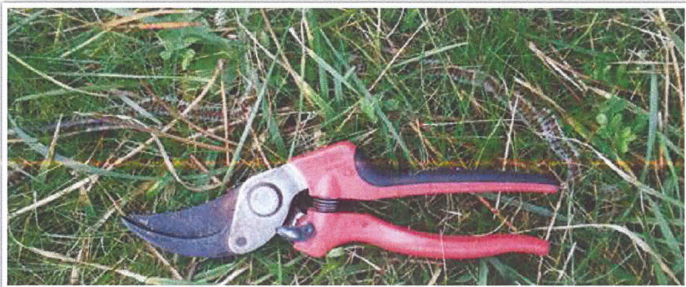
Discrète procession dans un gazon – Finistère sud, février 2018