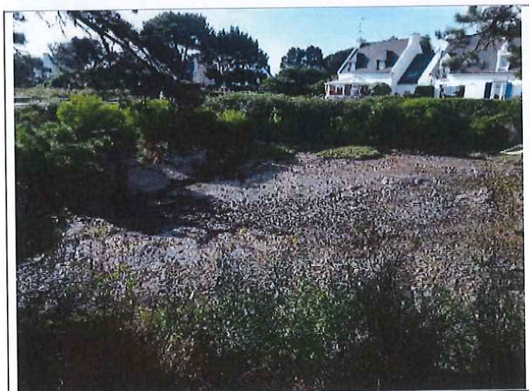
Figure 2 : Vue du bassin de Port Deun depuis le côté sud