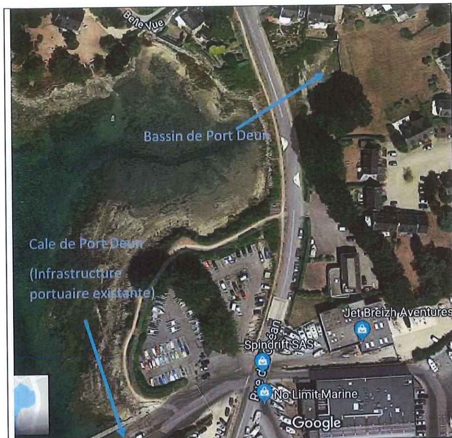
Figure 1 : Localisation du bassin de Port Deun (Google maps)