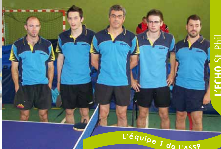
L'équipe 1 de l'ASSP

Championne du Morbihan en D3 et Championne de Bretagne