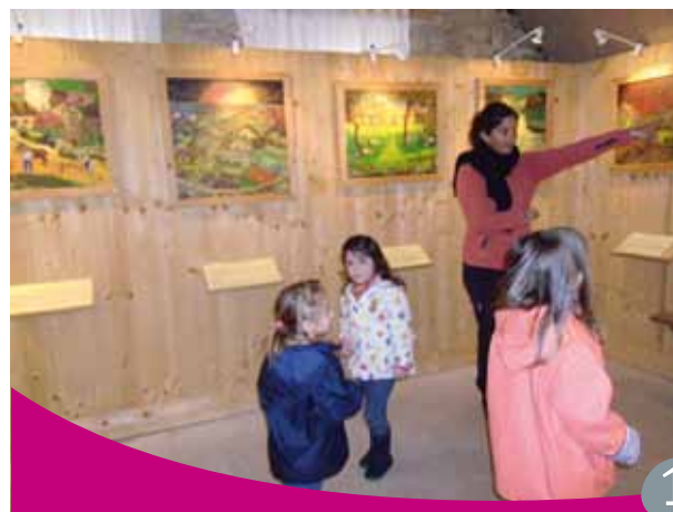
Exposition des oeuvres de Lucien Pouëdras à Saint-Dégan

L'histoire est mise à l'honneur en classe de CE puisqu'après un atelier autour du thème de la préhistoire sur le site de Kermario, une sortie en forêt de Brocéliande est envisagée pour le printemps.