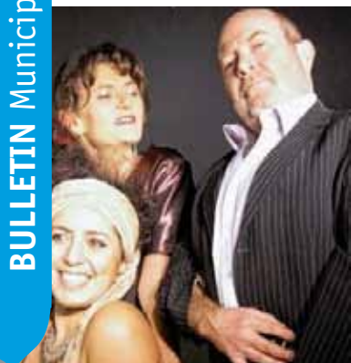
Dream a little dream