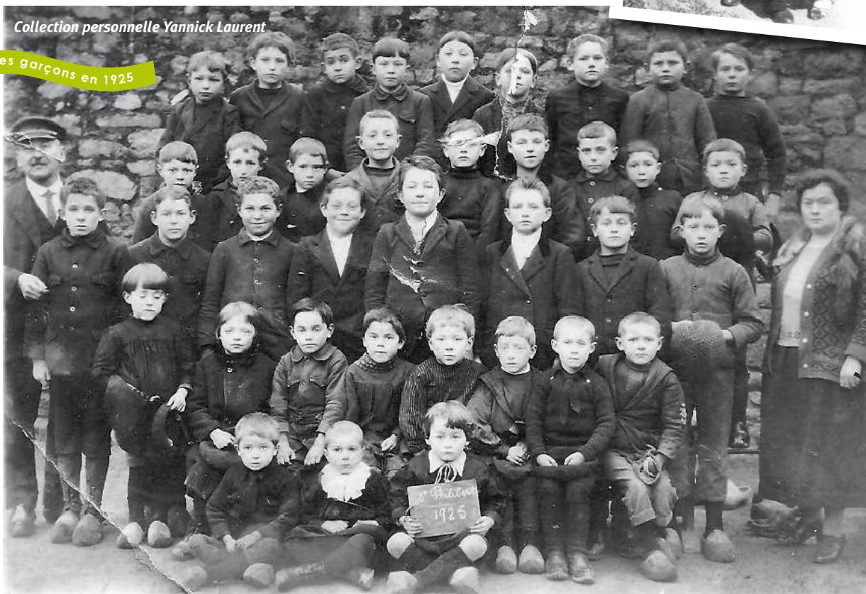
Ecole des garçons en 1925