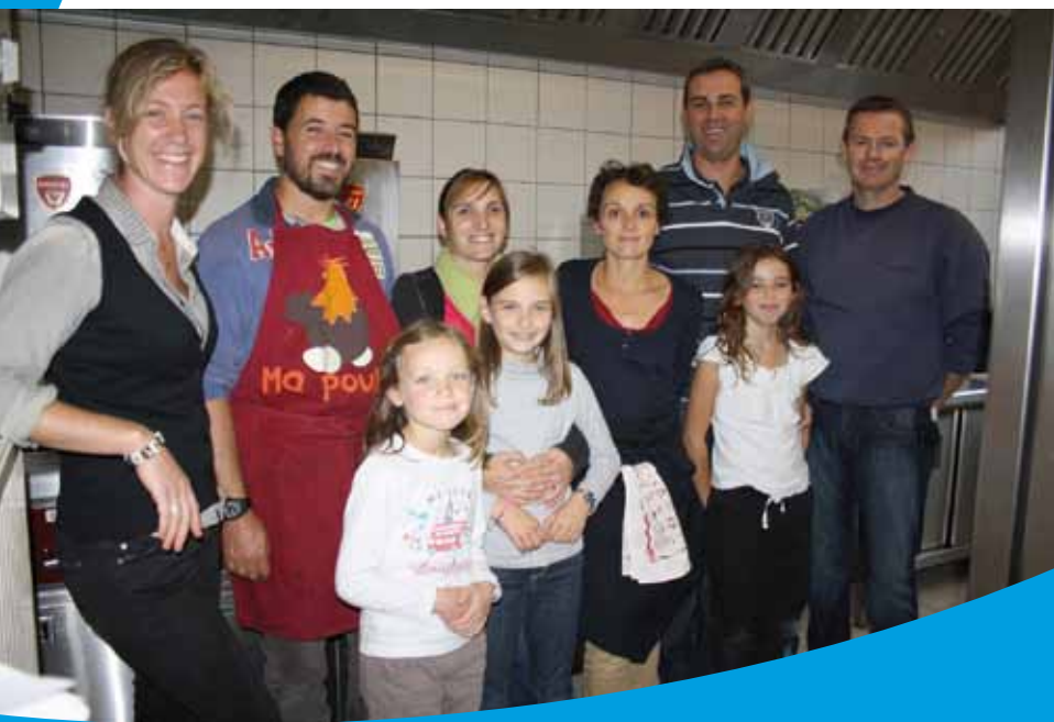
Parents bénévoles lors de la soirée Rougail du 12 octobre

Cette fin d'année est consacrée au marché de Noël et à ses ateliers de bricolage avec les enfants. Les ateliers ont réuni de nombreuses familles les 23 novembre et 7 décembre avec au programme : fabrication de guirlandes, de boules de Noël, de calendriers de l'aveugle... Tout est parti le samedi 14 décembre lors du marché de Noël qui a rassemblé plus de 20 exposants artisans. De 10h à 18h, petits et grands ont pu se retrouver autour d'un verre de vin chaud, après avoir salué le père Noël et écouté la chorale des lutins de l'école... Un temps fort de l'association qui plait toujours autant aux familles et qui permet d'animer la ville le temps d'une journée !