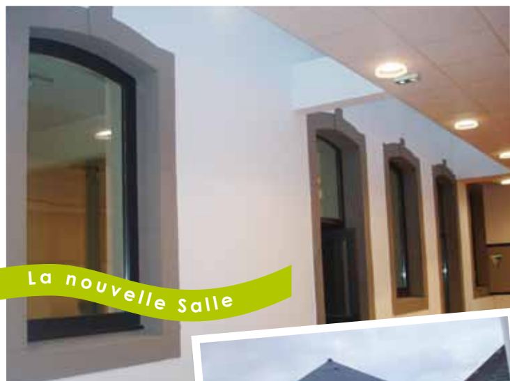
La nouvelle Salle